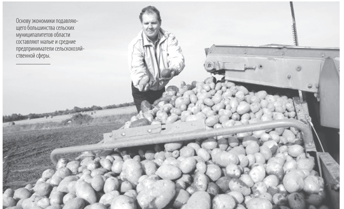
Основу экономики подавляющего большинства сельских муниципалитетов области составляют малые и средние предприниматели сельскохозяйственной сферы.

В МФЦ предприниматели смогут получить подробную информацию по вопросам получения микрозаймов и поддержки для экспортно-ориентированных субъектов малого и среднего предпринимательства. В дальнейшем планируется расширить этот перечень.