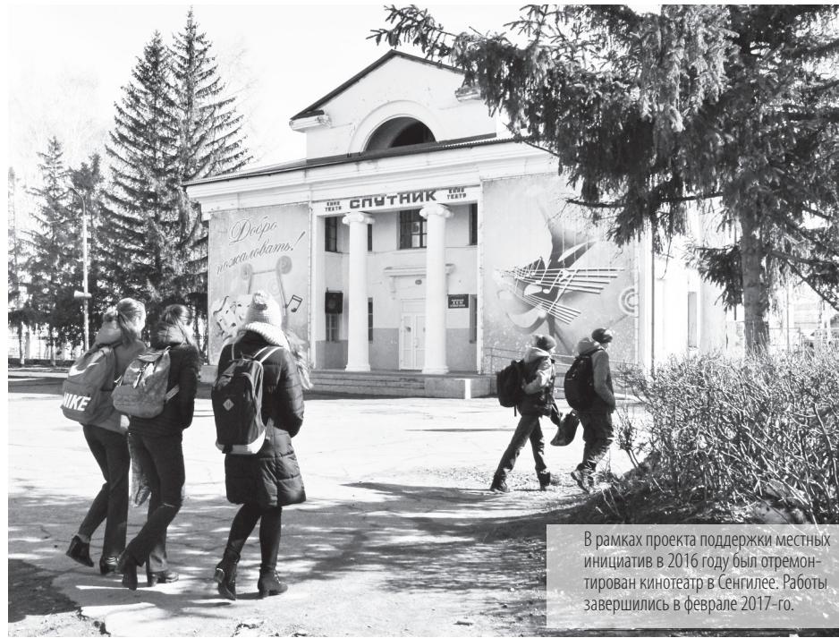
В рамках проекта поддержки местных инициатив в 2016 году был отремонтирован кинотеатр в Сенгилее. Работы завершились в феврале 2017-го.

Позитивный опыт Ульяновской области отметили во время всероссийского форума многие гости региона. В их числе и консультант программы поддержки