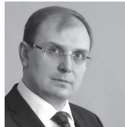
Александр Смекалин, председатель правительства Ульяновской области